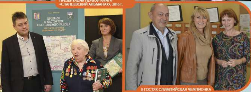
В ГОСТЯХ ОЛИМПИЙСКАЯ ЧЕМПИОНКА СВЕТЛАНА ЖУРОВА, 2017 Г.