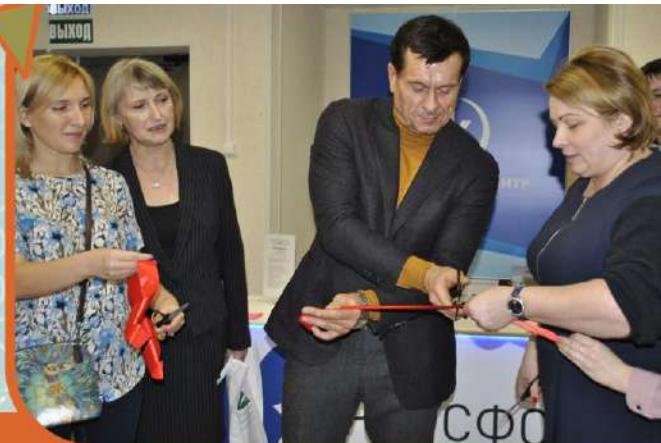
ОТКРЫТИЕ МОДЕЛЬНОЙ БИБЛИОТЕКИ