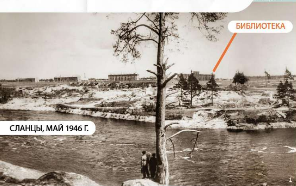
СЛАНЦЫ, МАЙ 1946 Г.

НО ОФИЦИАЛЬНАЯ ЛЕТОПИСЬ СЛАНЦЕВСКОЙ БИБЛИОТЕКИ ИСЧИСЛЯЕТСЯ С ФЕВРАЛЯ 1944 ГОДА. ДВУМЯ ПРИКАЗАМИ ПО СЛАНЦЕВСКОМУ РАЙОННОМУ ОТДЕЛУ НАРОДНОГО ОБРАЗОВАНИЯ №3 ОТ 14.03.1944 И №4 ОТ 15.03.1944 БЫЛИ НАЗНАЧЕНЫ ЗАВЕДУЮЩАЯ СЛАНЦЕВСКОЙ РАЙОННОЙ БИБЛИОТЕКОЙ КАЛИНИНА НАТАЛЬЯ ПЕТРОВНА И УТВЕРЖДЕН ШТАТ ЗАВЕДУЮЩИХ СЕЛЬСКИМИ ИЗБАМИ-ЧИТАЛЬНЯМИ.