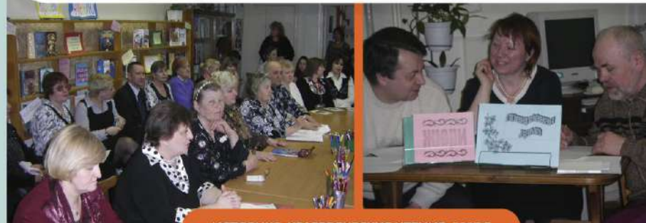
ИСТОРИКО-КРАЕВЕДЧЕСКИЕ ЧТЕНИЯ, 2007 Г.

БИБЛИОТЕКА СТАЛА МЕСТОМ ВСТРЕЧ УЧАСТНИКОВ ЛИТЕРАТУРНОГО ОБЪЕДИНЕНИЯ ГОРОДА.