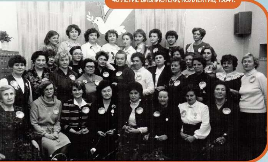
40-ЛЕТИЕ БИБЛИОТЕКИ, КОЛЛЕКТИВ, 1984 Г.

В 1992 ГОДУ ЗАКРЫЛИСЬ ВСЕ ПАРТИЙНЫЕ БИБЛИОТЕКИ, В ПЕРЕДАННЫХ В ФОНД ЦЕНТРАЛЬНОЙ РАЙОННОЙ БИБЛИОТЕКИ – ХОРОШАЯ ХУДОЖЕСТВЕННАЯ, СПЕЦИАЛИЗИРОВАННАЯ ЛИТЕРАТУРА. И ЭТО ВОСТРЕБОВАНО – В ПЕРИОД БЕЗРАБОТИЦЫ МНОГИЕ СТРЕМЯТСЯ ПОЛУЧИТЬ НОВУЮ ПРОФЕССИЮ.