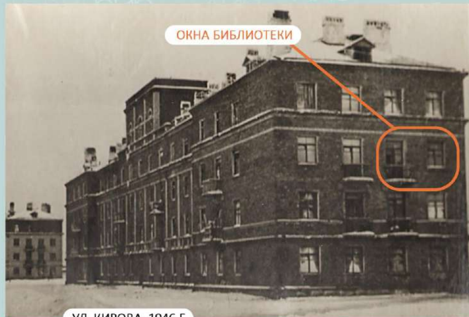
УЛ. КИРОВА, 1946 Г.