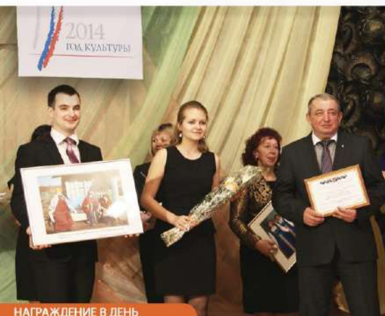
НАГРАЖДЕНИЕ В ДЕНЬ РАБОТНИКА КУЛЬТУРЫ, 2014 Г.

КОМПЛЕКТОВАНИЕ, ПОДПИСКА, ПРИОБРЕТЕНИЕ НОВОГО ОБОРУДОВАНИЯ, РЕМОНТЫ – НА ВСЁ УВЕЛИЧИЛИСЬ АССИГНОВАНИЯ.