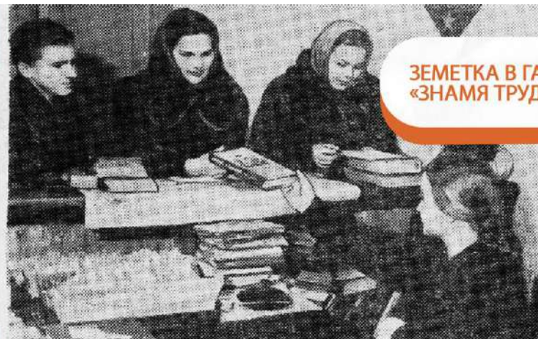
ЗЕМЕТКА В ГАЗЕТЕ «ЗНАМЯ ТРУДА» 1954 Г.

НА ОБНОВЛЕНИЕ ФОНДА ЕЖЕГОДНО ВЫДЕЛЯЕТСЯ ТЫСЯЧА РУБЛЕЙ. О ПОСТУПИВШИХ НОВИНКАХ БИБЛИОТЕКАРИ СООБЩАЮТ НА СТРАНИЦАХ МЕСТНОЙ ГАЗЕТЫ. НО, ВСЁ-ТАКИ, В БИБЛИОТЕКЕ СУЩЕСТВУЮТ ОГРАНИЧЕНИЯ - ЧИТАТЕЛЬ НЕ МОЖЕТ САМОСТОЯТЕЛЬНО ПРОЙТИ К СТЕЛЛАЖАМ С КНИГАМИ. НУЖНУЮ КНИГУ ЕМУ ВЫНОСИТ БИБЛИОТЕКАРЬ.