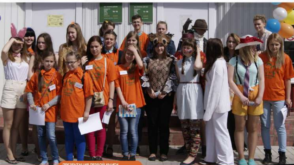
ПРЕЗЕНТАЦИЯ ПЕРВОЙ КНИГИ «СЛАНЦЕВСКИЙ АЛЬМАНАХ», 2016 Г.

2018 Г. - СЛАНЦЫ ОБЪЯВЛЕНЫ БИБЛИОТЕЧНОЙ СТОЛИЦЕЙ ЛЕНИНГРАДСКОЙ ОБЛАСТИ; - ПОДПИСАН ДОГОВОР О СОТРУДНИЧЕСТВЕ С ВСЕРОССИЙСКИМ МУЗЕЕМ А.С. ПУШКИНА.