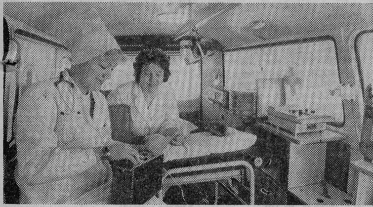
КАК ВАС ОБСЛУЖИВАЮТ?

В дежурной комнате раздается телефонный звонок. «03 слушает», — говорит диспетчер. Еще будут уточняться домашний адрес, фамилия, имя, отчество, возраст и другие необходимые данные, а дежурная бригада уже готова отправиться в путь.