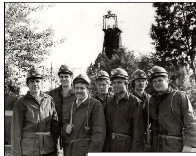
Шахта «Ленинградская». 1980-е гг.

Жизнь города с момента его появления определялась развитием сланцевой промышленности. На протяжении многих десятилетий производственное объединение «Ленинградсланец» являлось наиболее крупным по числу занятых на нем работников, в 1980-х гг. здесь трудилось 6 тысяч человек. В этот период в объединение входили три шахты, погрузочно-транспортное управление, ремонтно-механический завод, ремонтно-строительный участок, а также шахта «Кашпирская», расположенная в Куйбышевской области. Для трудящихся объединения в городе действовали Дом культуры горняков и клуб «Шахтер», известные своими самодеятельными коллективами, стадион «Шахтер». В 1970-х гг. на берегу реки Наровы появилась шахтерская база отдыха, а в сосновом бору на берегу реки Плюссы был построен прекрасно оборудованный санаторий-профилакторий на 100 мест. В 1970-х гг. появился клуб любителей яхтенного спорта на шахте «Ленинградская», действующий и поныне. В городе работал общетехнический факультет Ленинградского горного института, готовивший кадры для отрасли. Город поддерживал побратимские связи с шахтерским городом Кохтла-Ярве Эстонской ССР. Вместе с промышленностью рос, развивался и хорошел наш город. С 1960-х годов Сланцевский район на протяжении нескольких