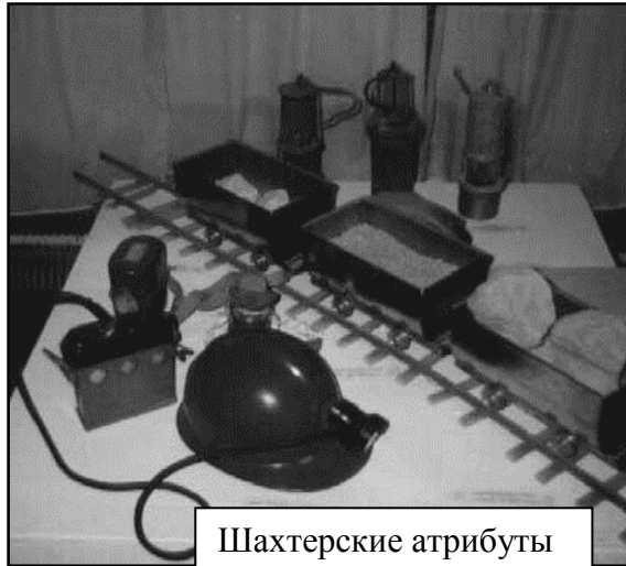
Шахтерские атрибуты в городском историко-краеведческом музее.

областного правительства возобновилась работа шахт. Есть перспектива того, что в ближайшее время предприятие возобновит свою работу на полную мощность - это позволит сохранить уникальный в мировом масштабе опыт сланцедобывающей и