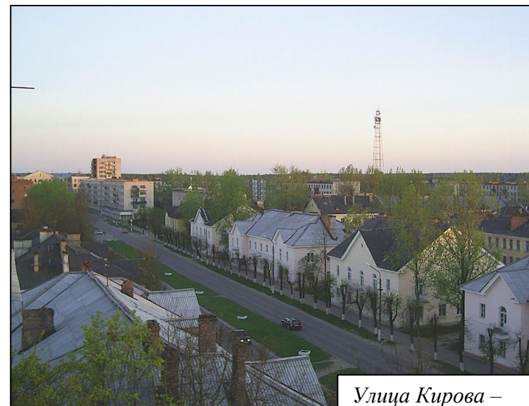
Улица Кирова – главная улица города.