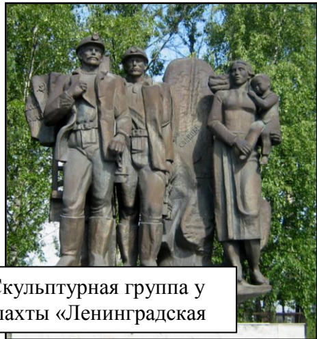
Скульптурная группа у шахты «Ленинградская»

сланцеперерабатывающей промышленности России. На территории Сланцевского района разведанные запасы сланца составляют порядка 1 миллиарда тонн и сегодня все то, что получают из нефти, можно получить из сланца - вплоть до бензина.