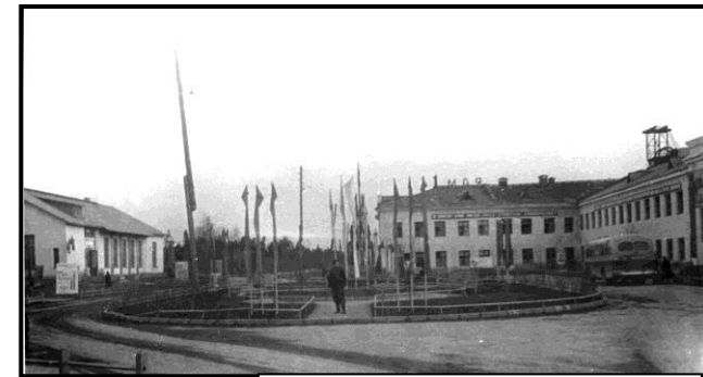
Шахта №1. 1950-е гг.

В марте 1941 года рабочий поселок Сланцы стал районным центром Сланцевского района, созданного Указом Президиума Верховного Совета РСФСР. В годы Великой Отечественной войны на долю жителей Сланцевского района выпали тяжелые испытания. С 17 июля 1941 года до 2 февраля 1944 года район был под оккупацией, поселок Сланцы и его промышленные предприятия были почти полностью разрушены. Шахтеры Ленбасса были в рядах патриотов-добровольцев, которые в самые первые дни войны отправились на фронт