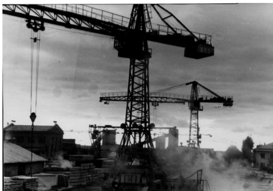
Комбинат «Стройдеталь», 1980-е.

25 лет (1991г., апрель) В Сланцевском районе зарегистрировано первое фермерское хозяйство.