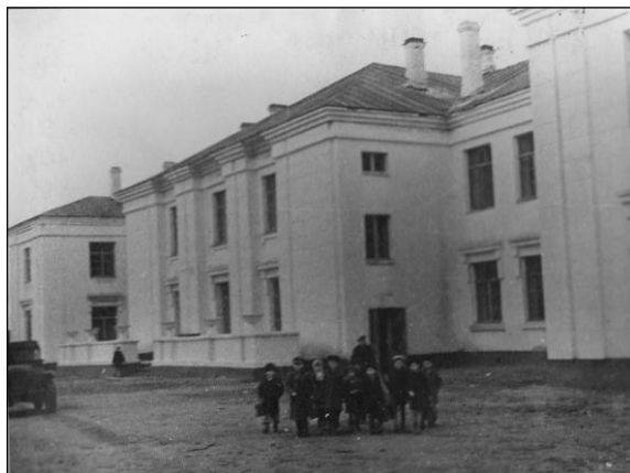
1945г. Восстановленное здание школы №5 (до войны – школа №2) на ул. Спортивная.