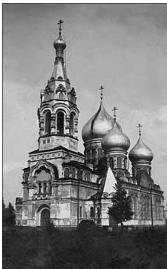
Храм Рождества Богородицы и часовня с источником св. Параскевы в Пенино, Сланцевский район. Построены 115 лет назад - в 1901г., архитектор Н.Н.Никонов.

и Чудотворца Николая (заложен 13 июня 1893г.; архитектор Н.Н. Никонов.)