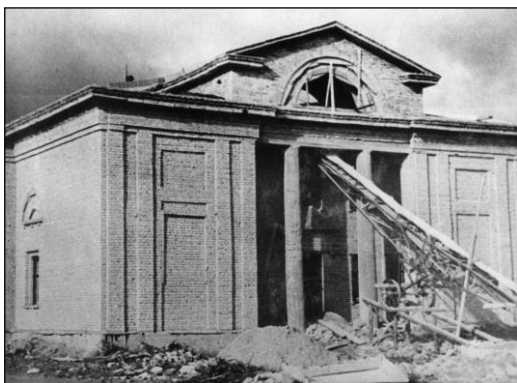
Строительство клуба «Шахтёр»