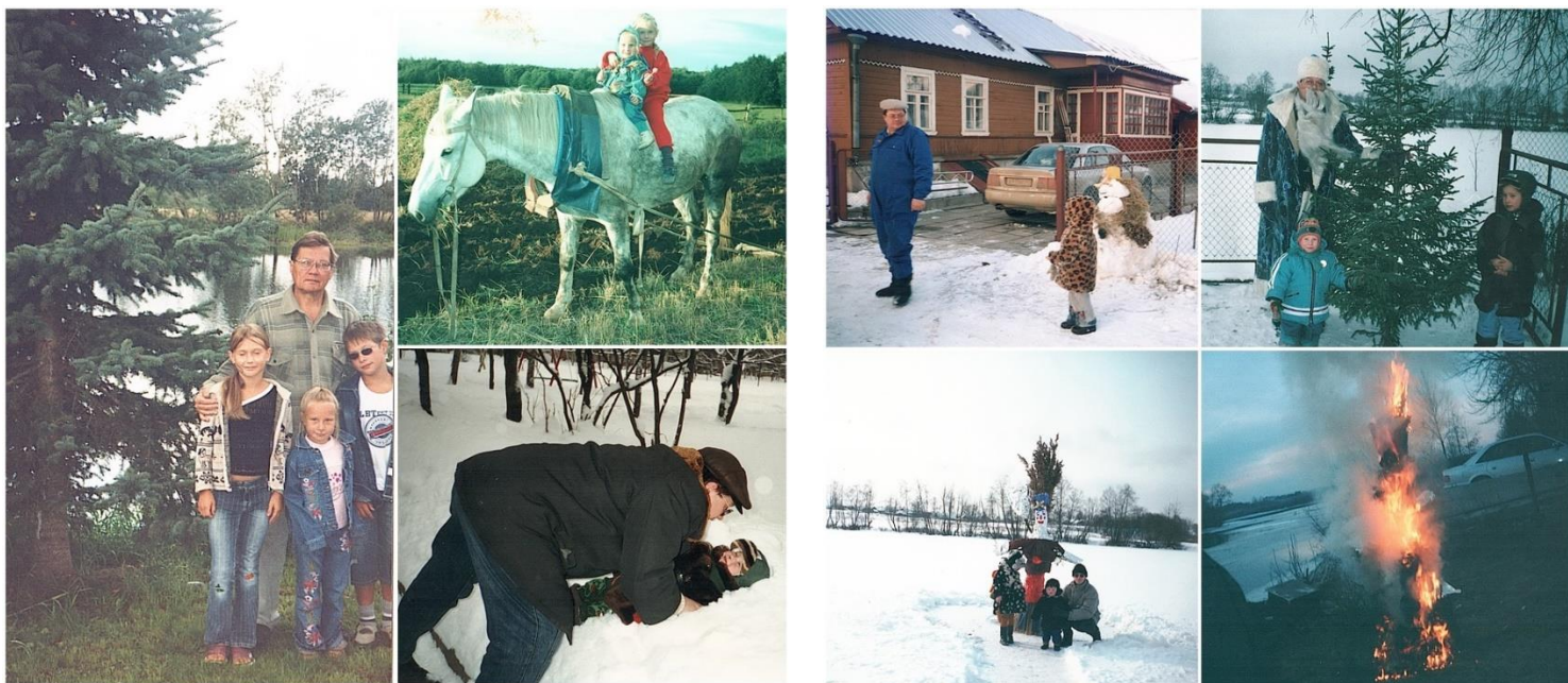
д. Малые Поля. Дедушка и внуки.

Во время дружеских застолий дети никогда не удались от взрослого стола, имея возможность на равных участвовать в любых разговорах и исполнении песен. Нецензурной брани, крика, ругани или скандалов в доме никогда не было.