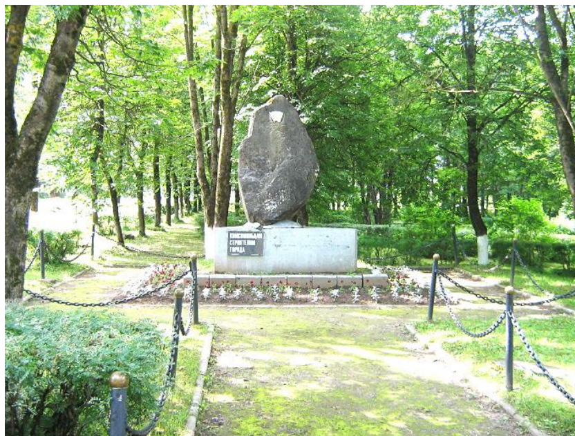
Памятник комсомольцам-первостроителям города