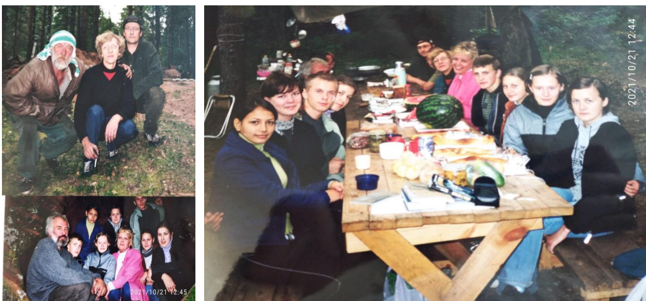
Ученики средней школы № 2 г. Сланцы на археологических раскопках. Городище «Горка», 2003 г.