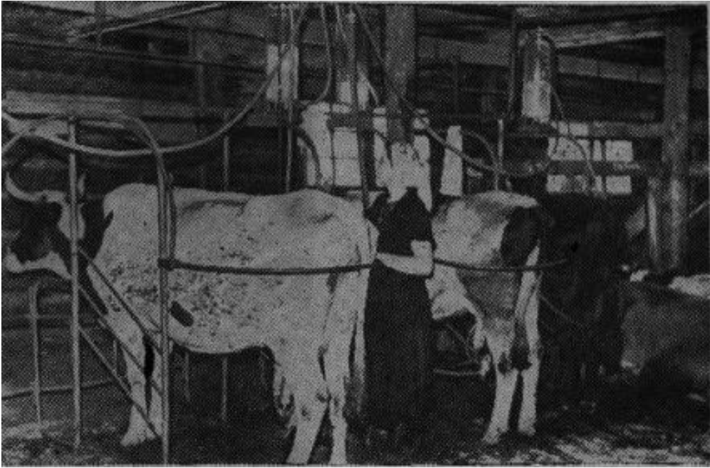
На кривицкой молочно-товарной ферме колхоза «Май», фото в газете 1960 года.