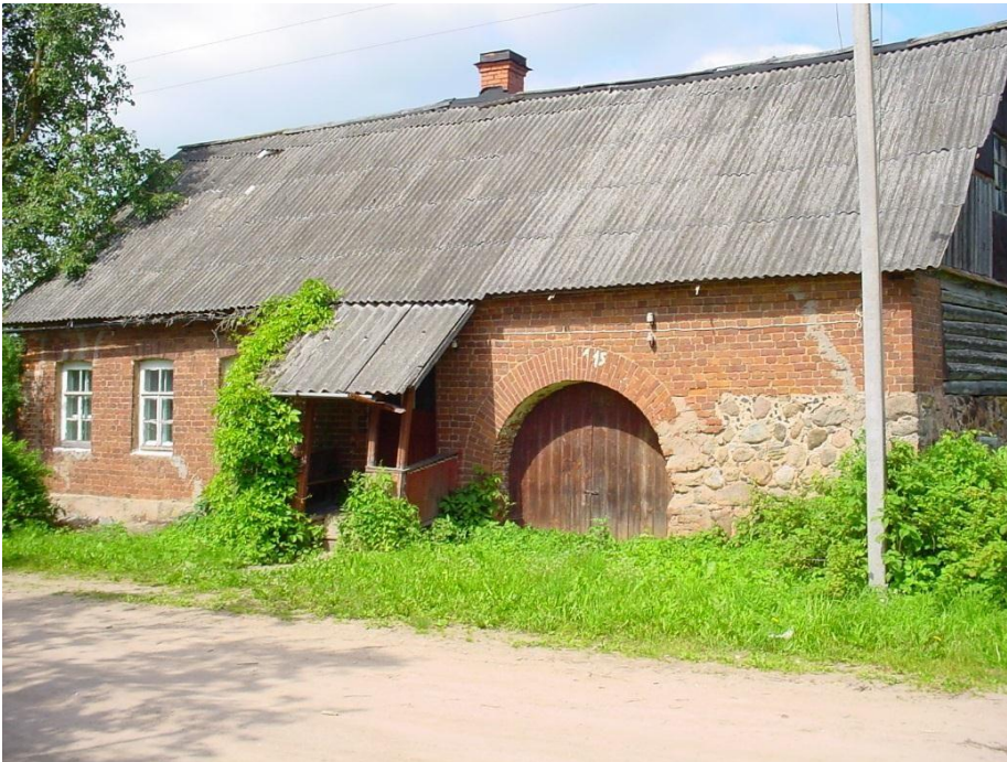
Дом постройки начала XX века, фото 2004 г.