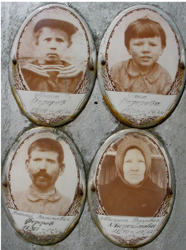
Надгробие семьи Федоровых на кривицком кладбище, фото 2004г.