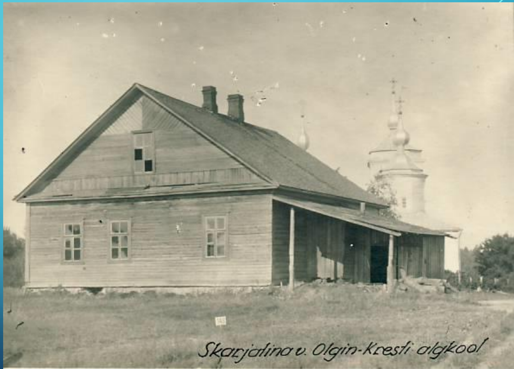
Skarjalina v. Olgin-Kresti algkool

Школа в Ольгином Кресте. На заднем плане - Крестоольгинская церковь. 1930-е гг.