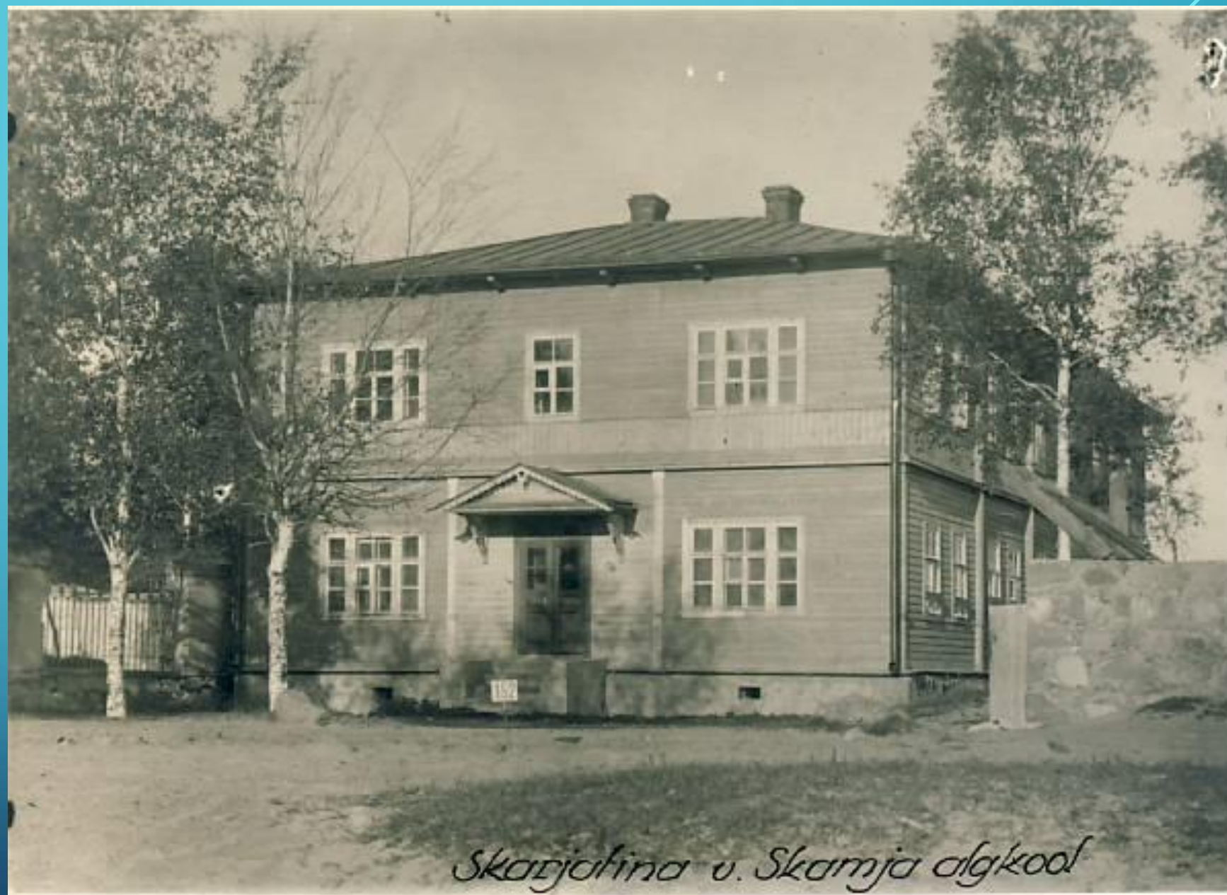
Skarjatina v. Skamja algkool