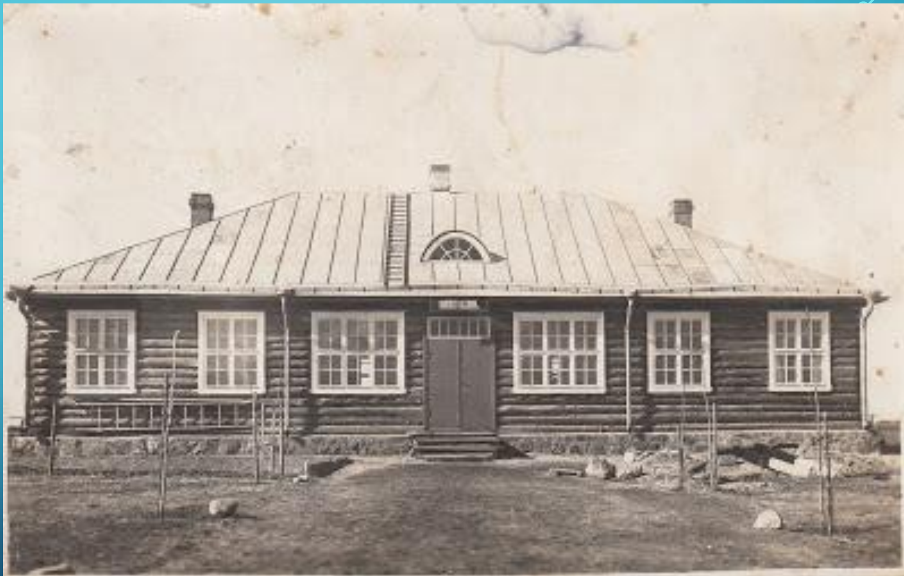
Школа в деревне Кондуши