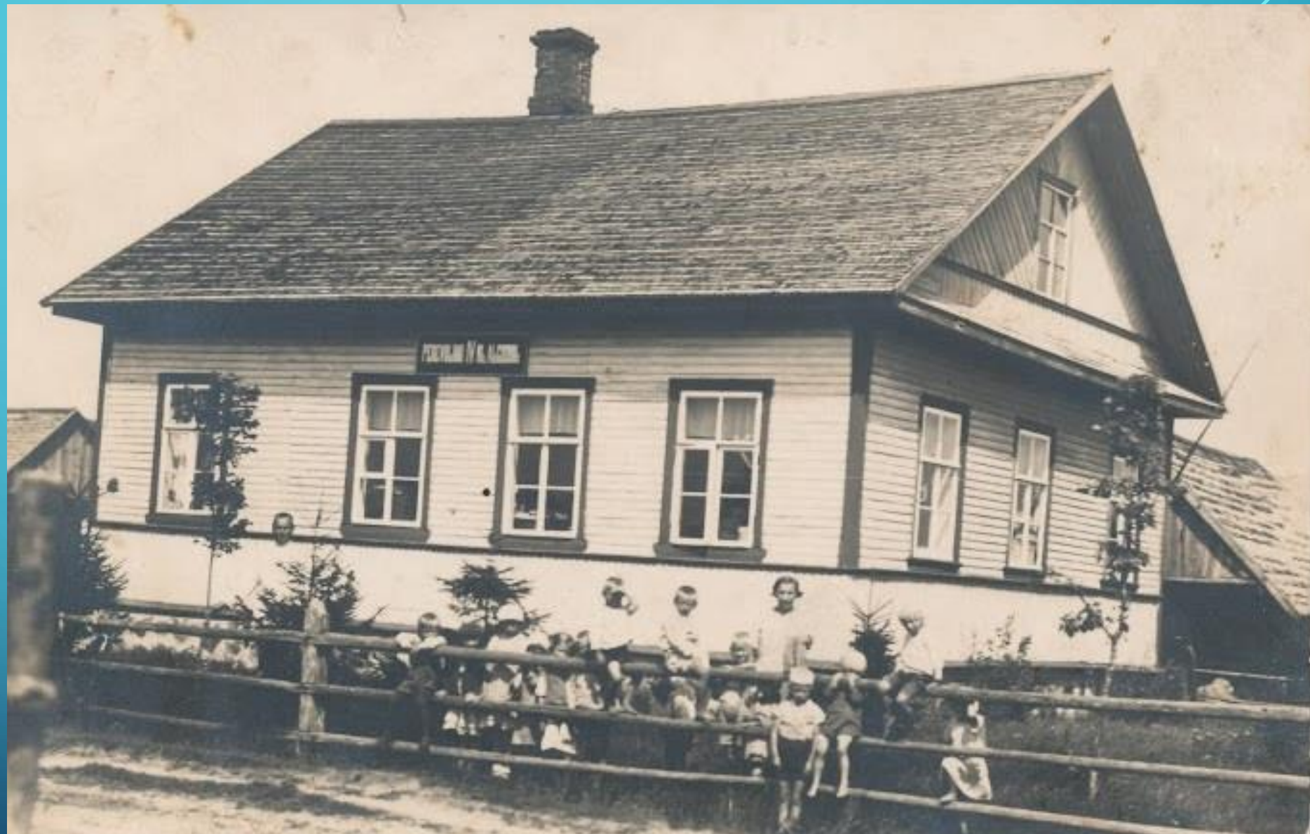
Здание школы в д. Переволок. 1930-е годы.