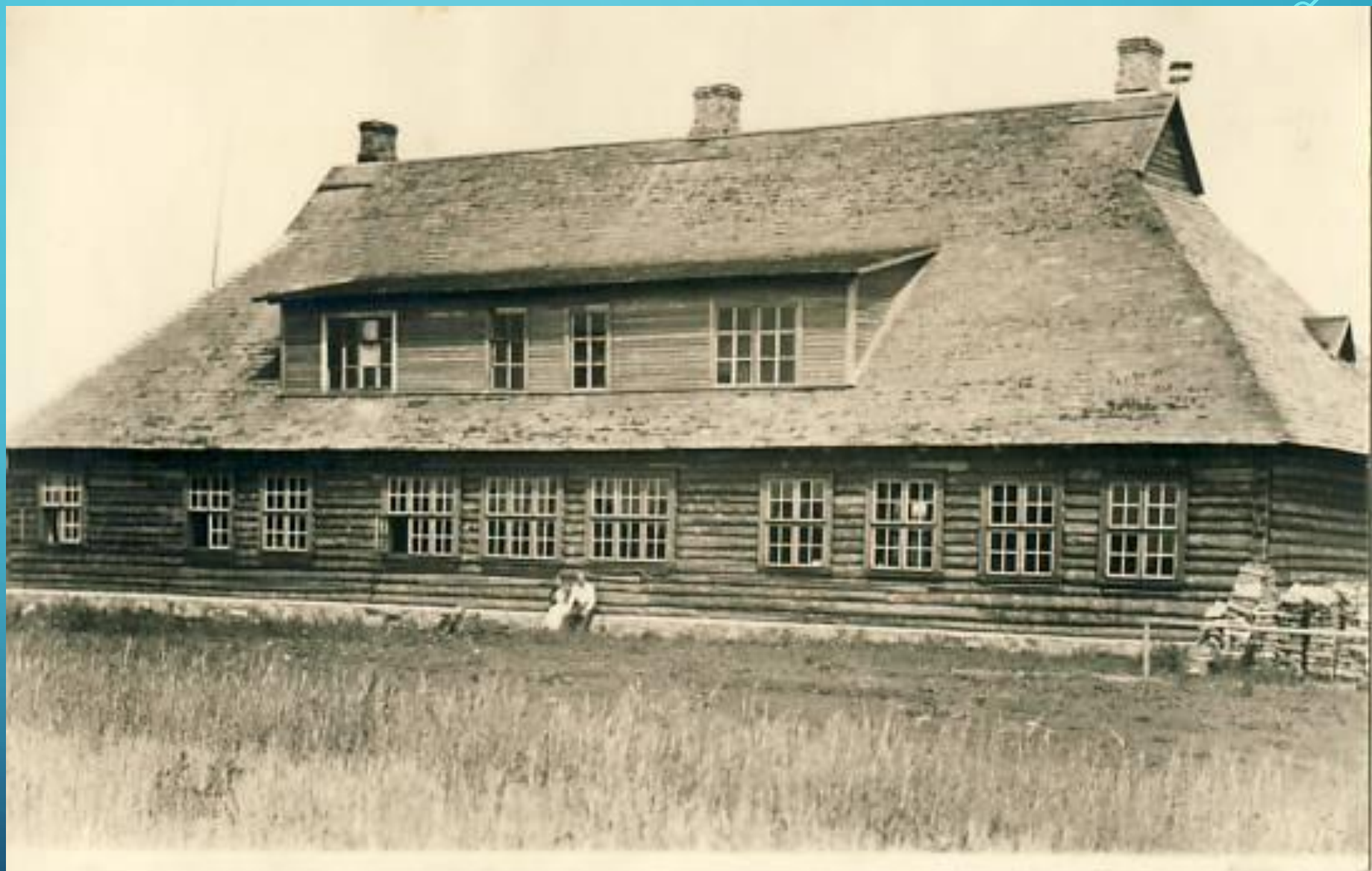
Деревня Загривье, здание школы. 1930-е гг.