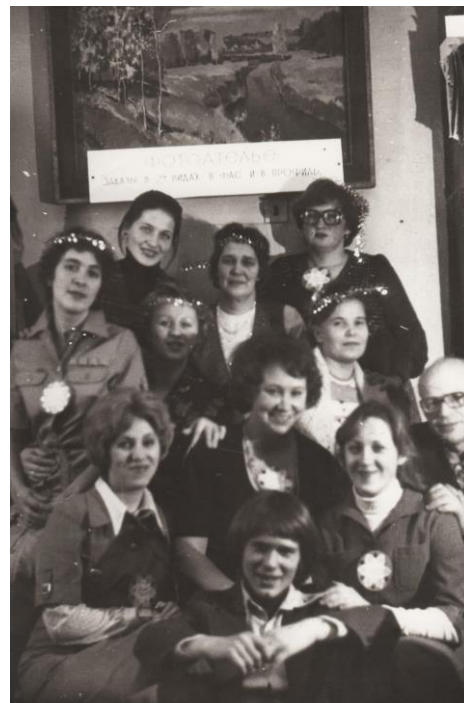
Участники литературного вечера