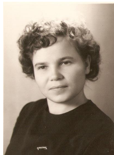
В начале профессионального пути