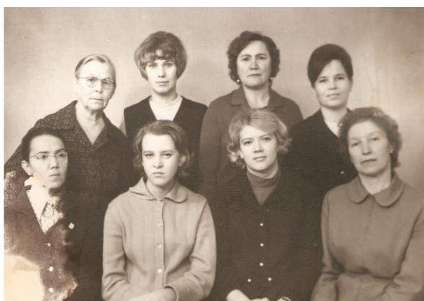
Коллектив библиотеки начала 70-х годов