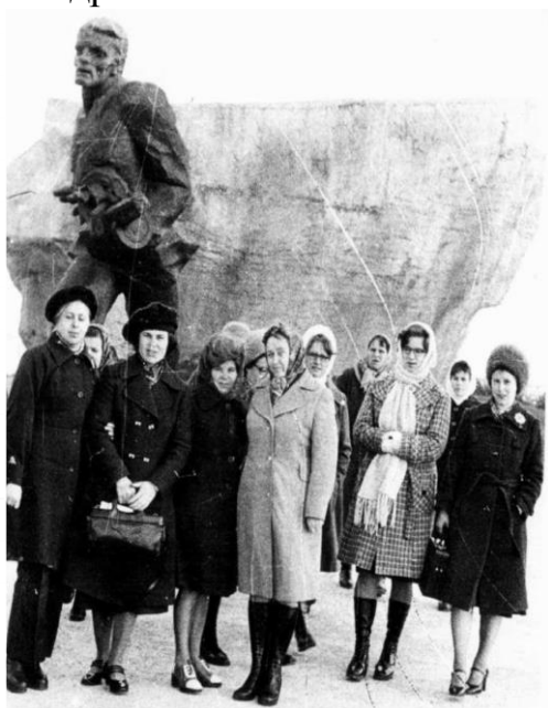
Профсоюзная поездка в Белоруссию

Ее участие выразалось в реальной поддержке конкретных людей: кому-то помогла устроиться на работу, кому-то дала дельный совет, а кого-то в прямом смысле сосватала и устроила личную жизнь.