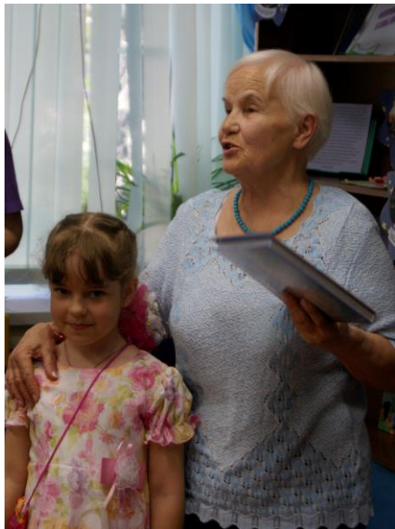
На Фестивале читающих семей