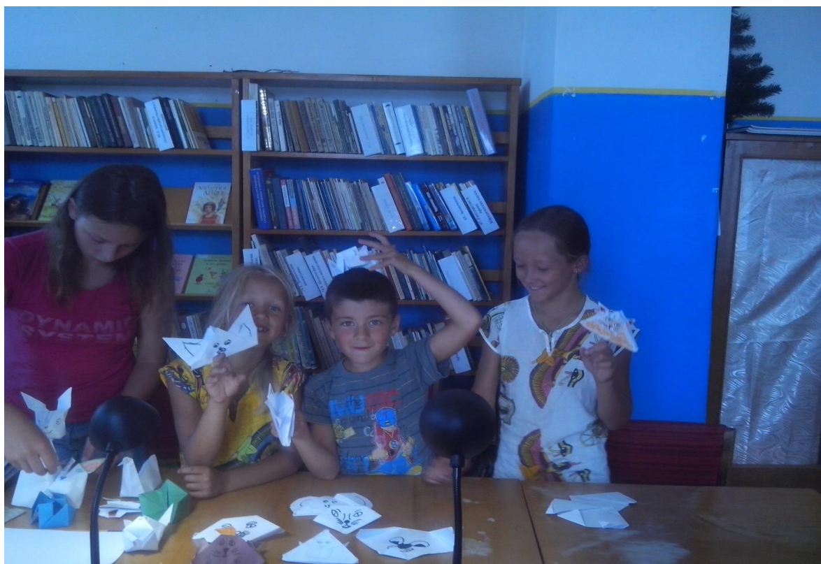
Мастер-класс по искусству оригами «Бумажные фантазии»

Летом и в дни школьных каникул библиотека работает с детьми. Они любят рисовать на разные темы. Все их рисунки хранятся в альбоме.