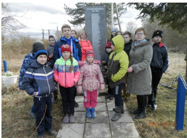
Краеведческий круиз по памятным местам поселения. У памятника погибшим односельчанам в д. Монастырек.

Проект « Читаем, рисуем и играем » для детей дошкольного возраста». Ребёнок этого возраста наиболее восприимчив к эмоционально -ценностному и духовно-нравственному развитию, гражданскому воспитанию. Пережитое и усвоенное в детстве отличается большой психологической устойчивостью.