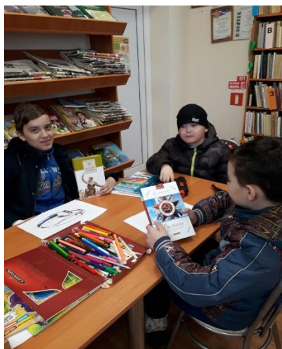
Час громкого чтения и обсуждения книги рассказов о войне.

Книги о войне... Они о многом предлагают ребятам задуматься: о жизни своих сверстников и всей страны в годы войны, о героических сражениях, о мужестве и стойкости нашего народа, о выборе между совестью и предательством, об умении договариваться и решать все проблемы мирным путем. Книги о войне нужно обязательно читать, через них передается память, уважение к подвигу, который совершили наши бабушки и дедушки.