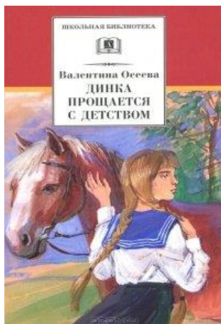
Современное издание книги В. Осеевой «Динка прощается с детством».

Любители ли вы читать? Этот вопрос часто задают библиотекари своим посетителям, а ученые уже подтвердили научно, что чтение очень полезно для здоровья мозга и психо-эмоционального состояния. Так почему же люди читают или не читают? Я думаю, что не читают те, кто еще просто не встретил ту книгу, чтение которой затронет до глубины души и вызовет потребность читать и читать еще. Для меня такой книгой, любимой с детства до сего дня, стала дилогия В. Осеевой «Динка» и «Динка прощается с детством». Боевая и деятельная натура Динки покоряет любого, кто знакомится с ней на страницах этих книг. Истории, когда Динка, не раздумывая приходит на помощь каждому, например, своей соседке и подружке Федорке (очень бедная семья Федорки хотела ее отдать замуж за старого вдовца), очень теплые, любящие взаимоотношения в семье Динки, трогательная история первой любви – все это сделало для меня в детстве и подростковом возрасте понятными и приемлемыми многие жизненные вещи. И, часто обращаясь к этой книге, я понимаю, что прав Вольтер – книга может стать настоящим другом.