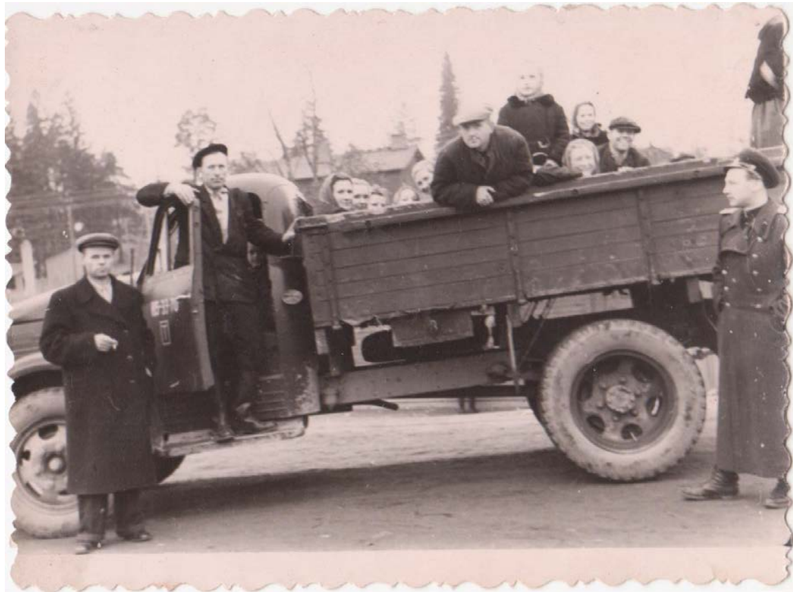
Коллективная поездка на работу по восстановлению разрушенных объектов. 1947 год.