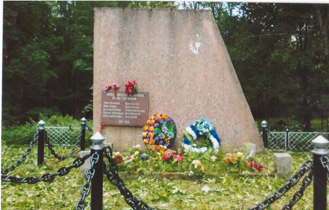
Памятник погибшим партизанам в д. Щепцы Гдовского района Ленинградской области