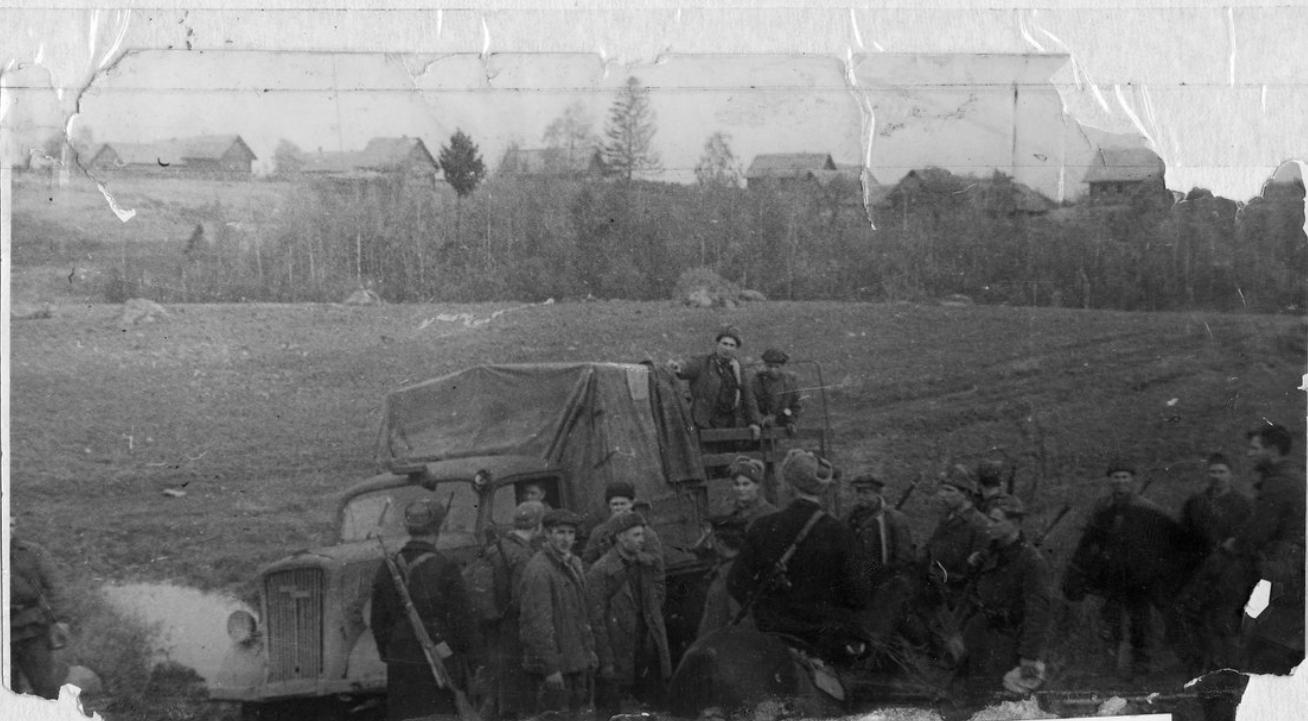
Партизаны Гдовщины после боя у подбитой немецкой машины, 1943г.