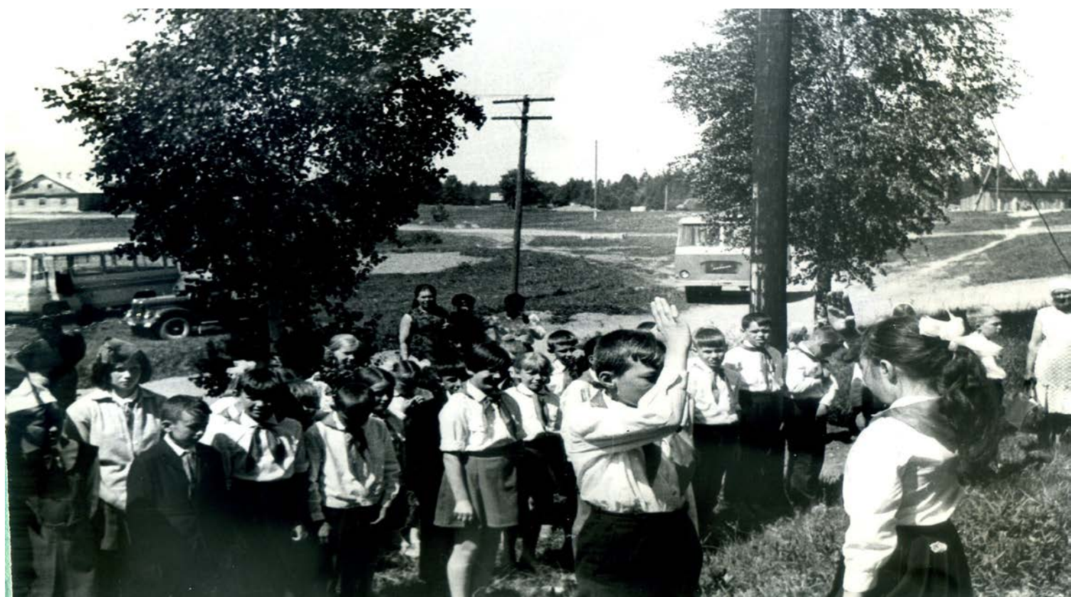
СБОР ПОСВЯЩЕННЫЙ ПАМЯТИ ПАРТИЗАНКИ ИРЫ НИКОЛАЕВОЙ ОТКРЫТ (1972 г.)