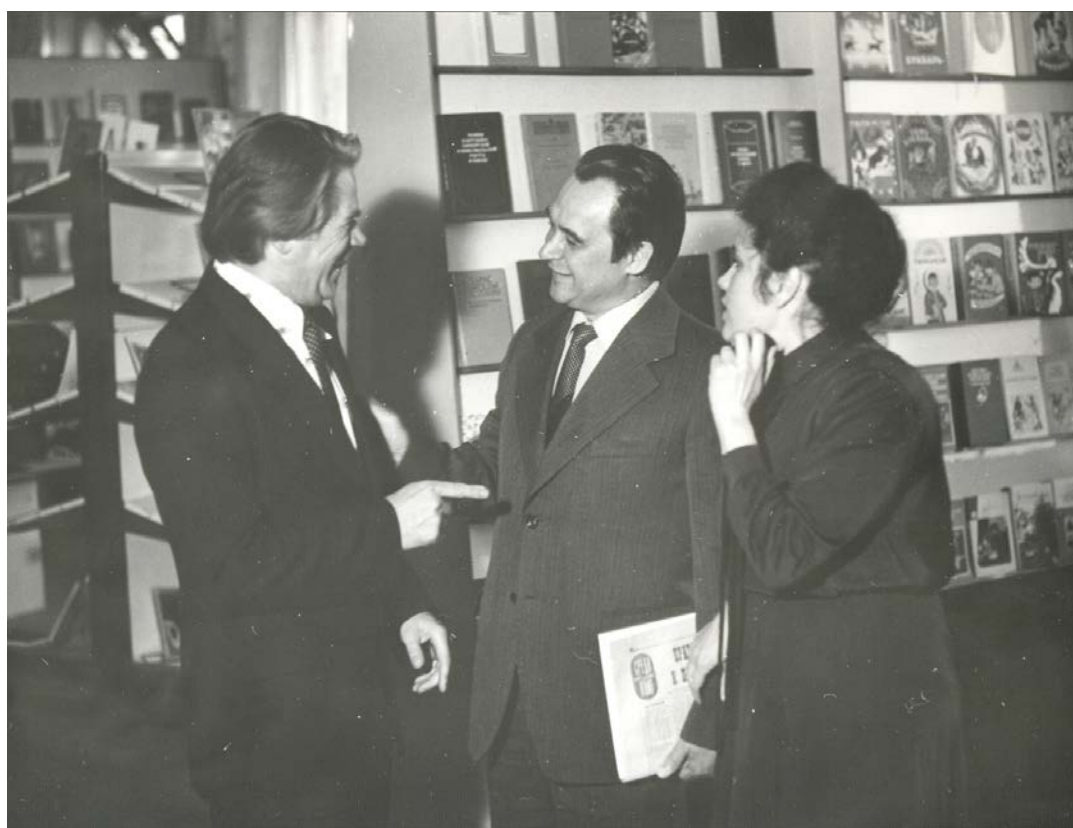
На встрече с читателями в библиотеке г. Гдова