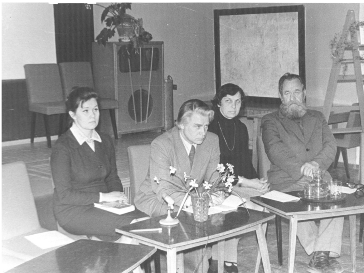
На встрече в Псковской областной библиотеке