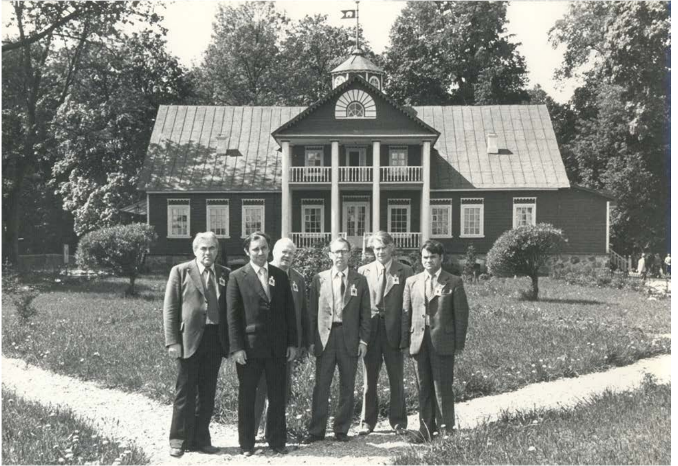
На Всероссийском Пушкинском празднике поэзии в п. Пушкинские Горы