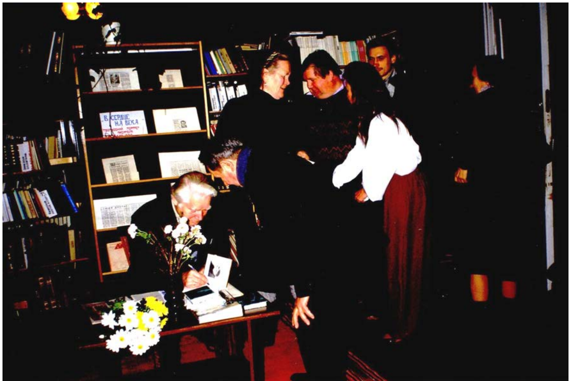
С читателями в Гдовской районной библиотеке