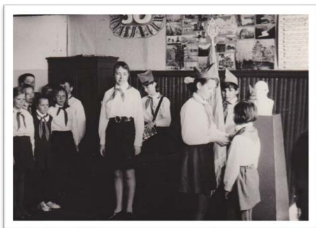
(Прием в пионеры на торжественной линейке)