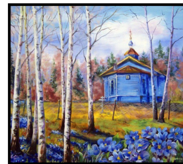
«Рассвет. Храм Архангела Михаила», 2016 (д. Сижно)