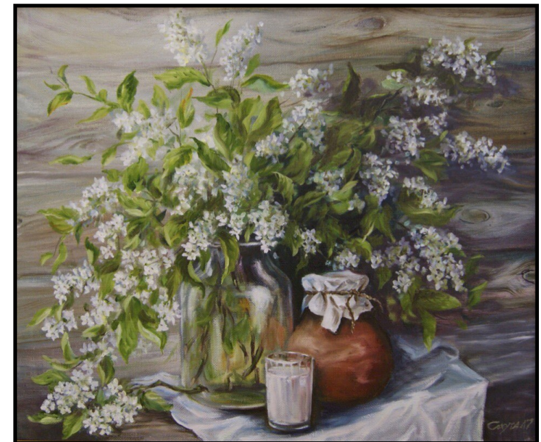
«Черёмуха душистая», 2017