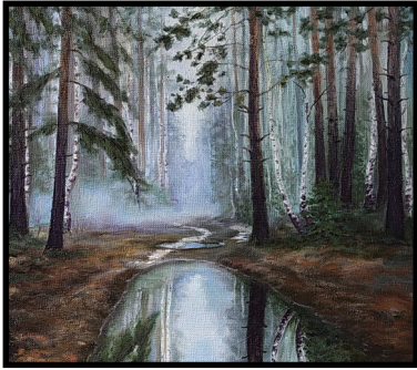
«Раннее утро», 2014