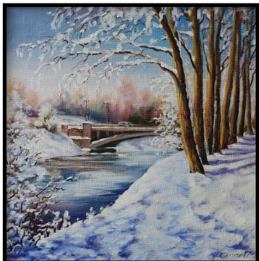
«Сланцы. Набережная. Декабрь», 2017