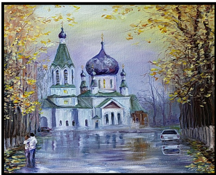
«После дождя», 2016 (Храм Серафима Саровского)