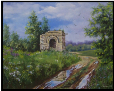
«Руины часовни Рождества Пресвятой Богородицы», 2016 (д. Кошелевичи)