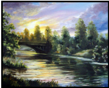
«На Плюссе вечер», 2017