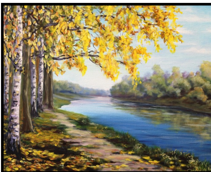
«Крутые Плюсы берега», 2016