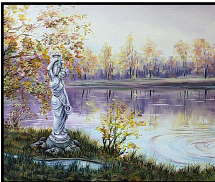
«Самарянка», 2016 (деревня Сижно)