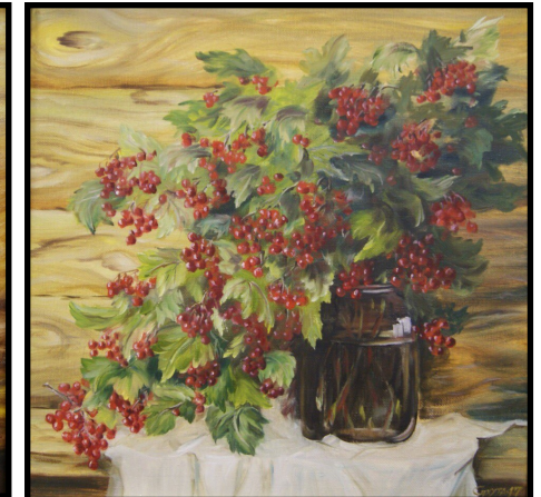
«Спелая калина», 2017