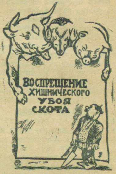
— КОРОВЫ: Хватит, попили нашей крови.

Чрезвычайно важным рассадником не только в условиях района, но и всей Ленинградской области является рассадник в Говоровском колхозе «Овцевод». Порода овец в Говорове выделяется вырисовывается на фоне остального стада в районе. Поэтому сейчас взят курс на расширение говоровского стада и на постройку овчарни новейшего типа.