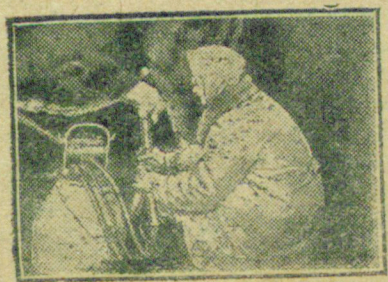
НА СНИМКЕ: Электрическая дойка коров.