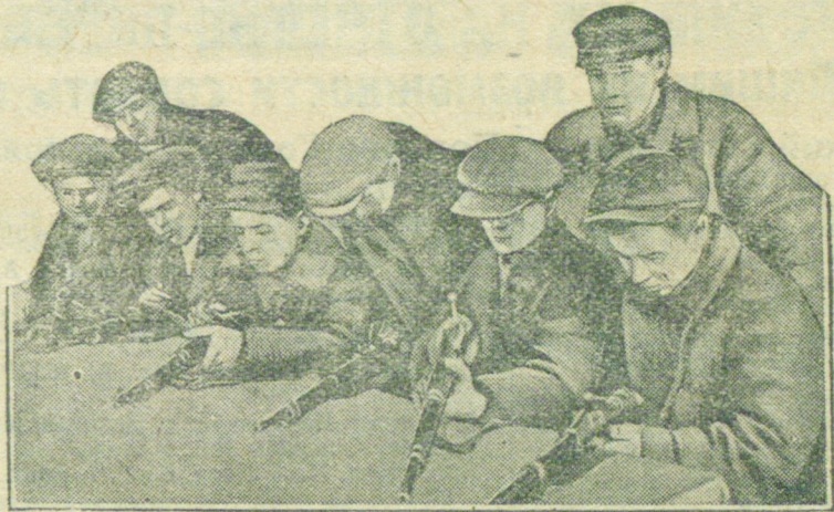
НА СНИМКЕ: Члены ячейки Осоавиахима «Красного Путиловца» знакомятся с устройством винтовки.