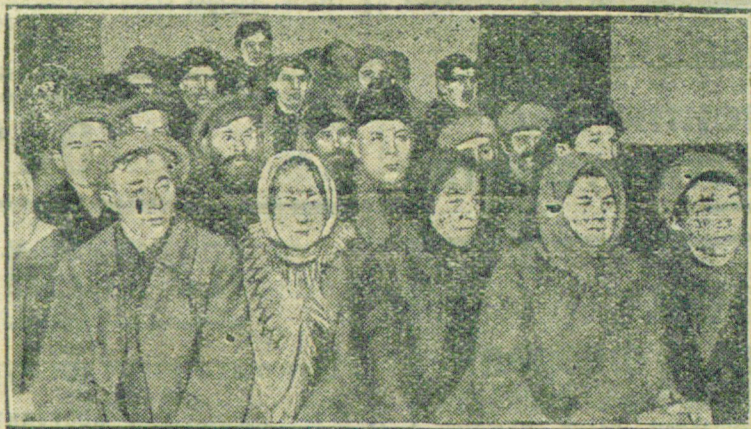
НА СНИМКЕ: Собрания бедноты слушает доклад представителя РИК'а о задачах перевыборов советов.