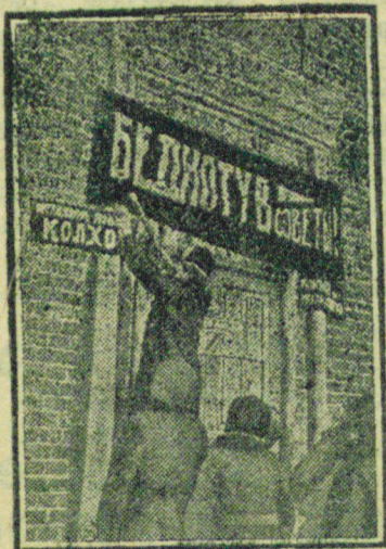
НА СНИМКЕ: Школьники вывешивают плакат о перевыборах советов.