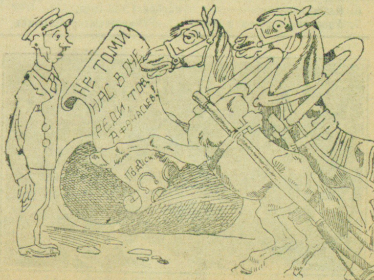
В Райзу дело № 18 по случае коней утеряно...