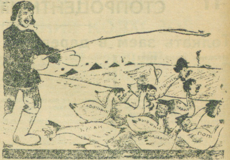
«Конъюктурная» разница у Горбовских, Савиновщинских, Лужецких оберегается от глаз Райфо.

Партийным, комсомольским и обществ. организациям необходимо выделить кандидатов для учебы с тем расчетом, чтобы курсы начать с 15 июня.