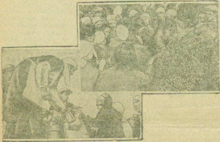
Выскацкий к с/хозный базар. Продажа молока с воза

Ответ. Сельсовет не только может, но и обязан дать льготу красноармейской семье, даже в том случае, если хозяйство не имело возможности представить документы. Для этого сельсовет должен сам добыть необходимые справки либо из военного стола РИК'а, либо из Военкомата, либо из отделения милиции и т. д.