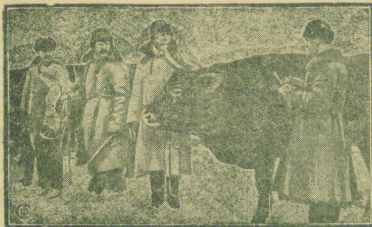
Из теленка выращивать таких бычков и коров.

Первые десять дней теленок должен получить молоко от матери, после чего допускается спайвать молоко и от других коров но обязательно здоровых; не надо допускать спайвания телятам сборного молока, особен-