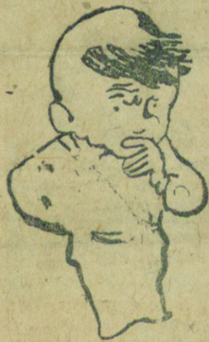
— Да, хозрасчет дело хорошее. Только вот для нас это плохо. Подумайте же сами, нужен будет все время сидеть в цехе...

На бухгалтерию возложена обязанность повседневное руководство и оказание помощи низовым