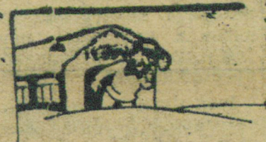
— Маркшейдера на горизонте еще не видать...