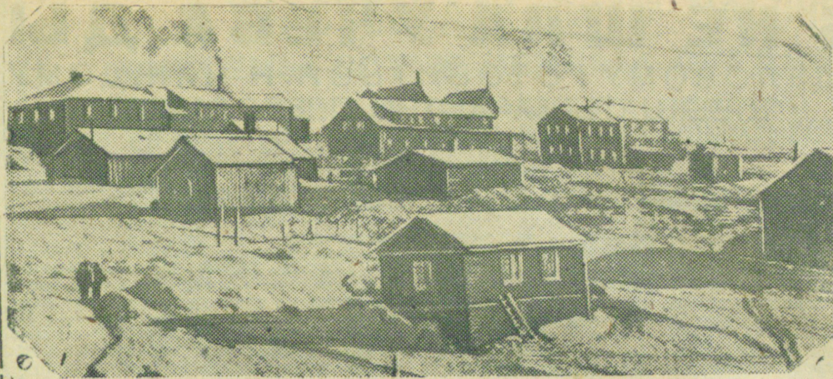
Далеко на Севере за полярным кругом на острове Шпицберген налажена добыча бурого угля. На снимке вид рабочего поселка где живут арктические горняки.