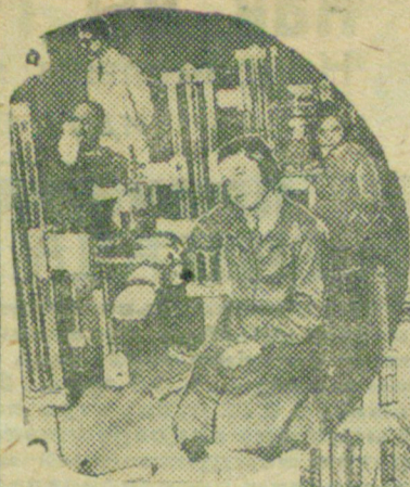
Травмоолегическому институту исполнилось десять лет