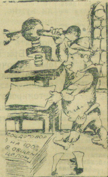
Штамповка идет полным ходом лад.