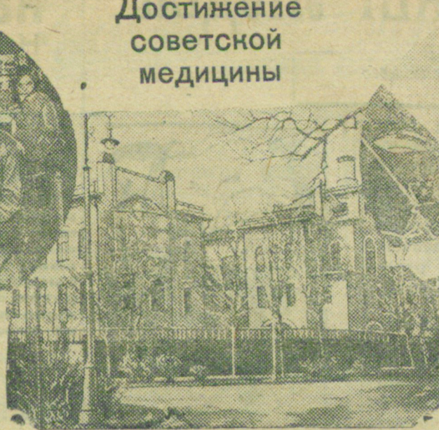
На снимках: кабинеты и здание института