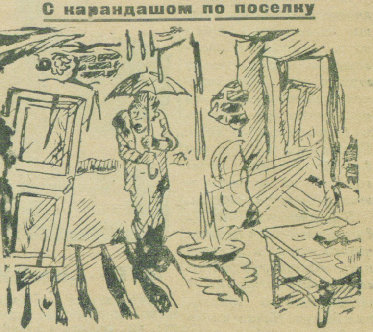
Мрачная картина, дождик без конца

Один несомнительный гражданин, уже вращавшийся пообещав за недорогую цену насильно в карман не-