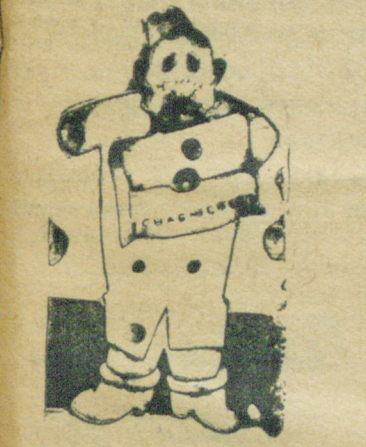
Рождествов: Разве я могу взять: я же без рук.

К очередям привлекли. Совершенно не удивляет сейчас огромный хвост в приемной здравпункта. Люди идут лечиться. У многих зуб болит, у многих с животом неладно, а то просто какая-нибудь заноза в палец забралась.