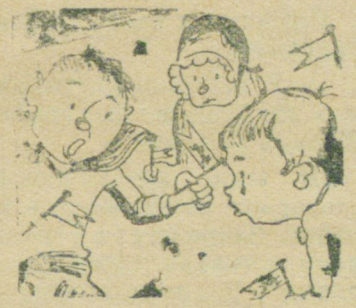
Тимофеев: Посмотрите! Разве можно нас на хозрасчет перевести? Мы маленькие.

От работы отдела снабжения зависит ход строительства. С неразберихой и безответственностью в отделе пора кончать. Надо перевести отдел на жесткий хозрасчет.