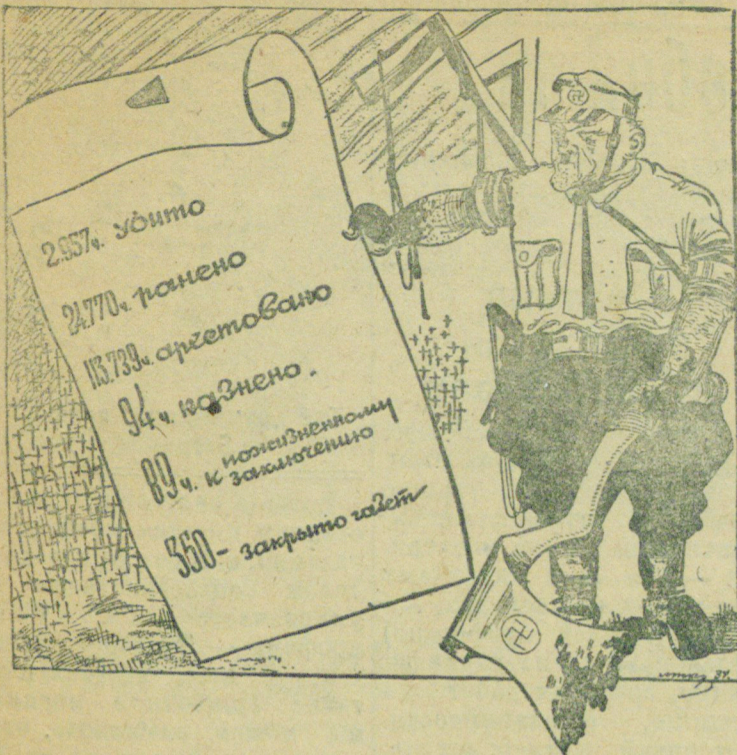
Итоги полугодовой "работы"

Тип. "Гдов. кол." Зак. № 277 Уполн. Облгорд. № 153. Тир. 1200 Колл. знак. 54.540