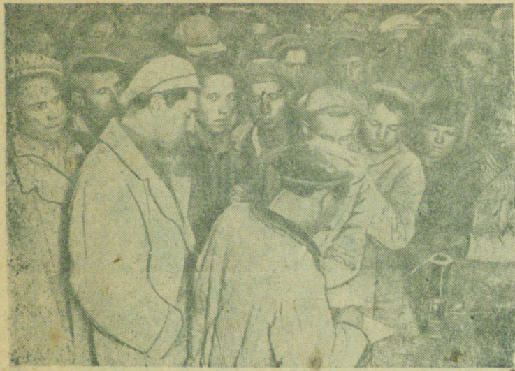
В нарядной шахты перед спуском в лавы