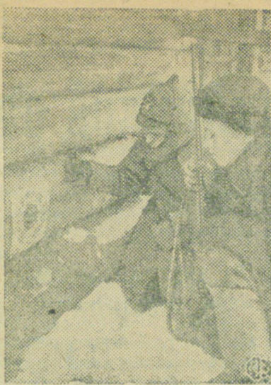
Череповецким военкоматом организована выездная бригада для проверки весенней подготовки и общей грамотности колхозников-допризывников.