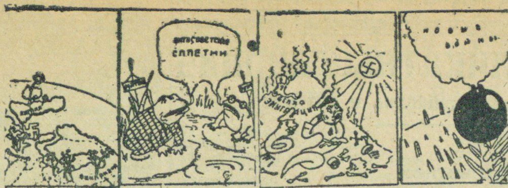
Весна. 1. Зацвели цветочки. 2. Земляк лягушки... 3. Согреты солнцем зашевелились белые гады... 4. И воздух все больше насыщается ароматами 1914 года.