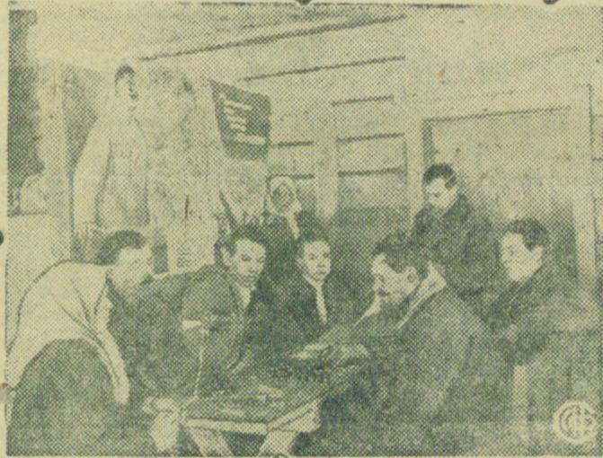
Хорошо работает красный уголок при Кубинском лесопункте Петриневского района.

В красном уголке имеются газеты, журналы, шашки, радио. НА СНИМКЕ: лесорубы в красном уголке.