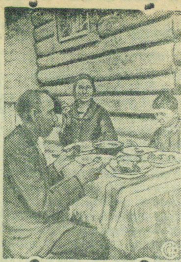
За сытным обедом.