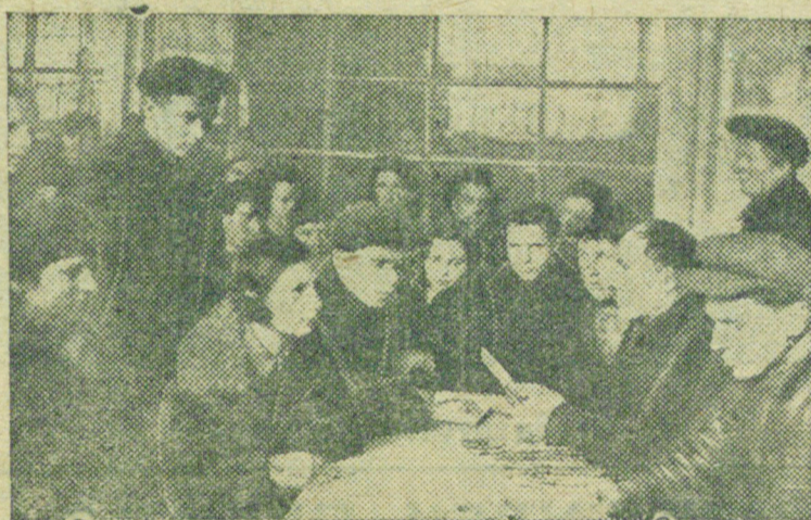
Беседа о текущей политике в красном уголке цеха.