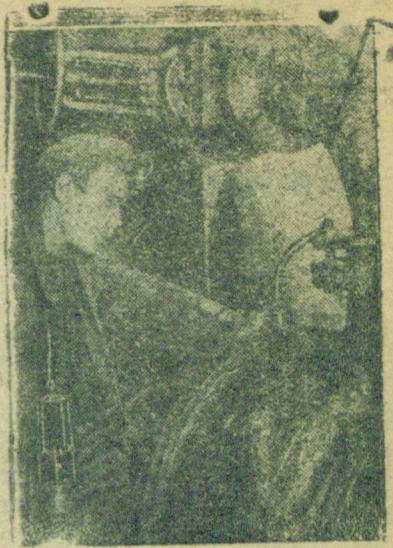
Камеронщик у водоотливного насоса.