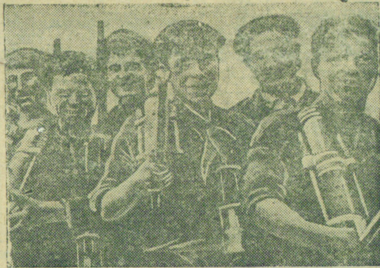
Передпуском в шахту.

*) В скобках трехнедельный фонд зарплаты.