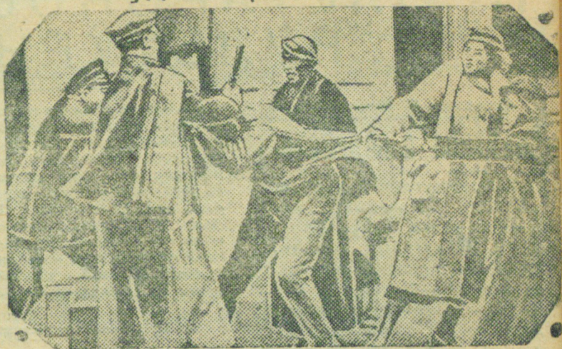
Полиция арестовывает рабочего.