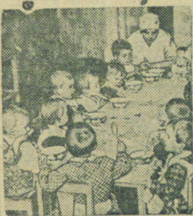
Дети в столовой.