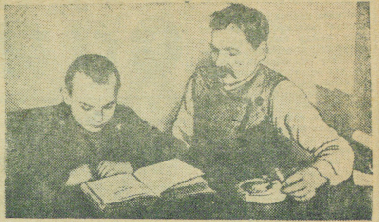
За чтением книги...