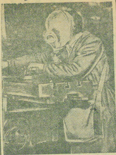
Над миром нависла угроза новой войны более зверекой, чем все известные до сих пор в истории. Учись защищаться от противника! На снимке: Работа в противогазе.