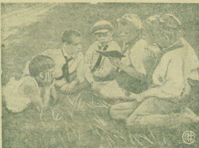
ПИОНЕРЫ В ЛАГЕРЯХ

В центральных газетах опубликовано большое письмо народа Дагестана т. Сталину, собственноручно подписанное 560 тыс. человек. Пятнадцатилетие Дагестана вылилось в подлинный народный праздник.