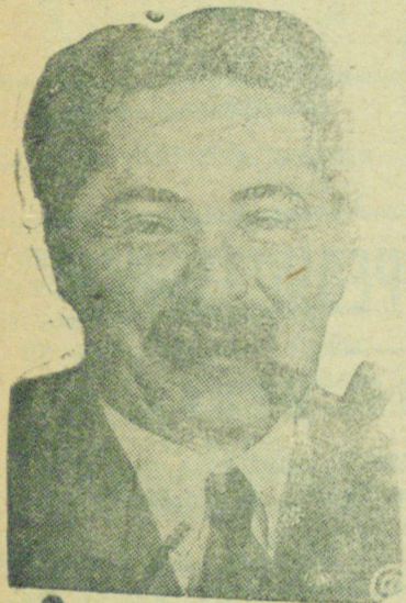
Т. В. МАНУИЛЬСКИЙ член исполкома Коминтерна.