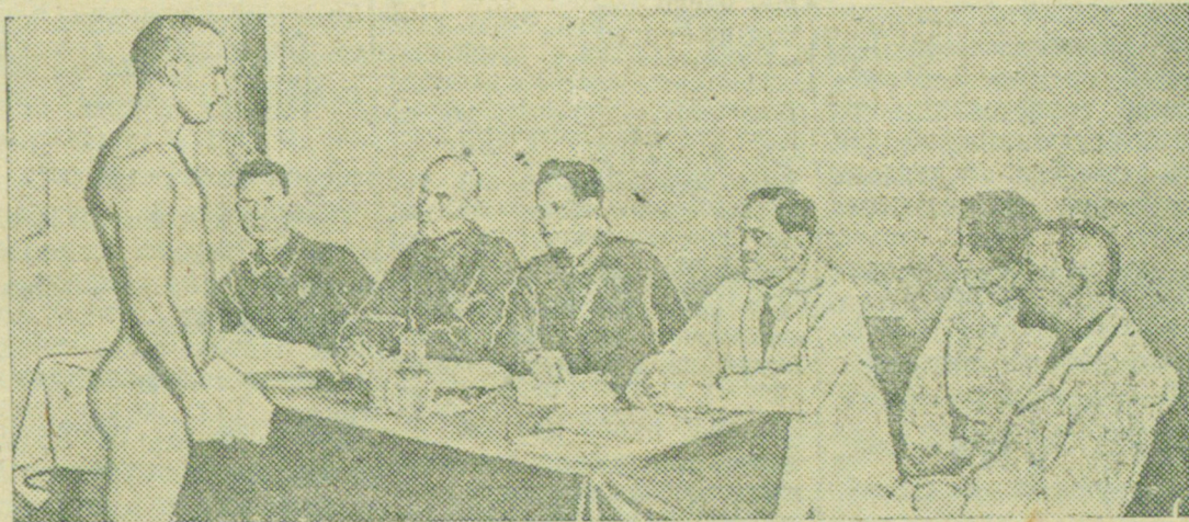
Призывник на медицинском осмотре.