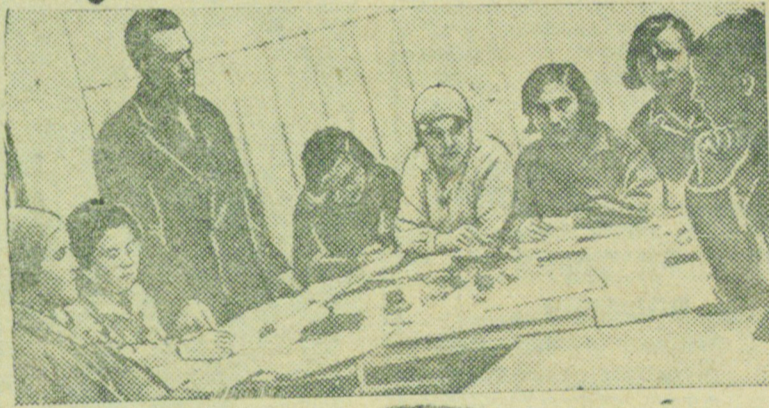
Прорабатывают решения конгресса Коминтерна.