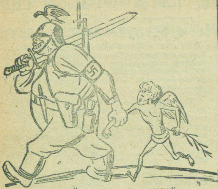
ОГОЛТЕЛЫЙ ФАШИЗМ „ЗА РАБОТОЙ“