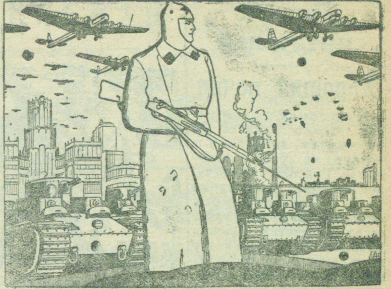
Стоим на страже своих границ...

Мы не даем рецепта „как стать активистом“, но совершенно очевидно, что быть полноценным активистом без этих основных черт характера нельзя. И, наоборот, чем полнее и многообразнее они выражены, тем больше активист будет иметь права носить почетное имя комсомольского организатора.