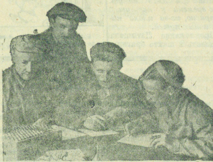
Читают и продумывают стахановский метод

От этого значительно увеличится производительность. Эта бригада может перекрыть свой первый рекорд — 117 бадей за 5 часов работы.