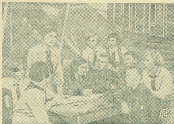
Совет пионерского отряда обсуждает план проведения детской недели.