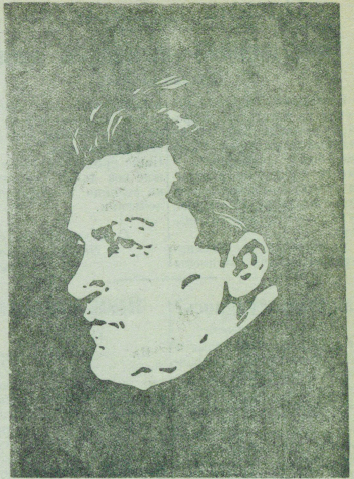
Портрет Кирова С. М. (Рисунок художника ЕЛИСЕЕВА)