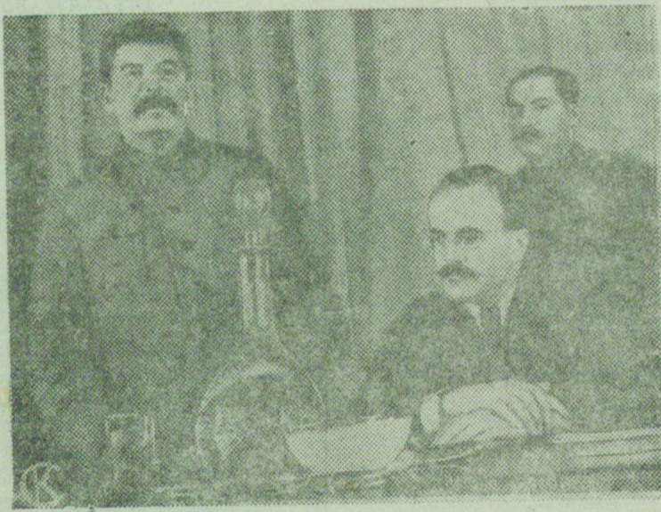
1 декабря 1935 года в зале заседаний ЦК ВКП(б) проходило совещание передовых комбайнеров и комбайнеров с членами ЦК ВКП(б) и правительства.