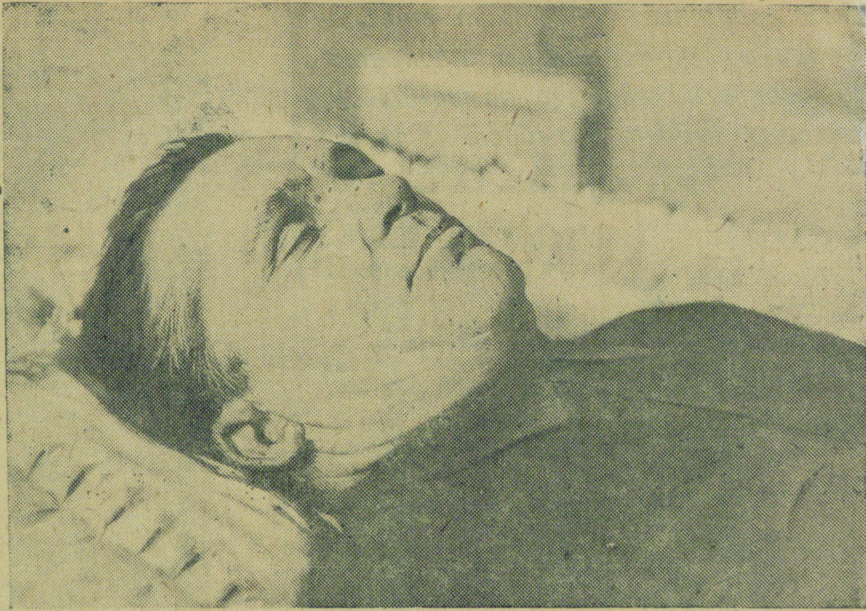
Сергей Миронович Киров в гробу.