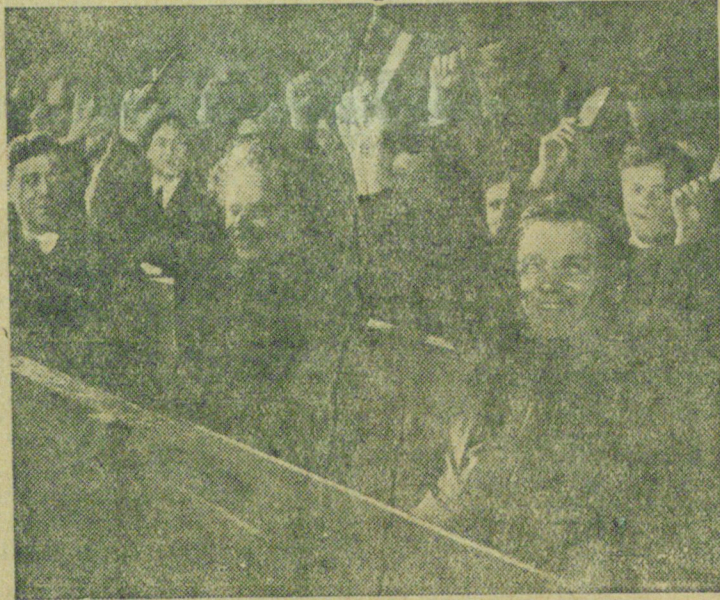
Ленинградская делегация голосует на XVII с'езде партии

И. БОГДАНОВИЧ — управляющий 1-м рудником