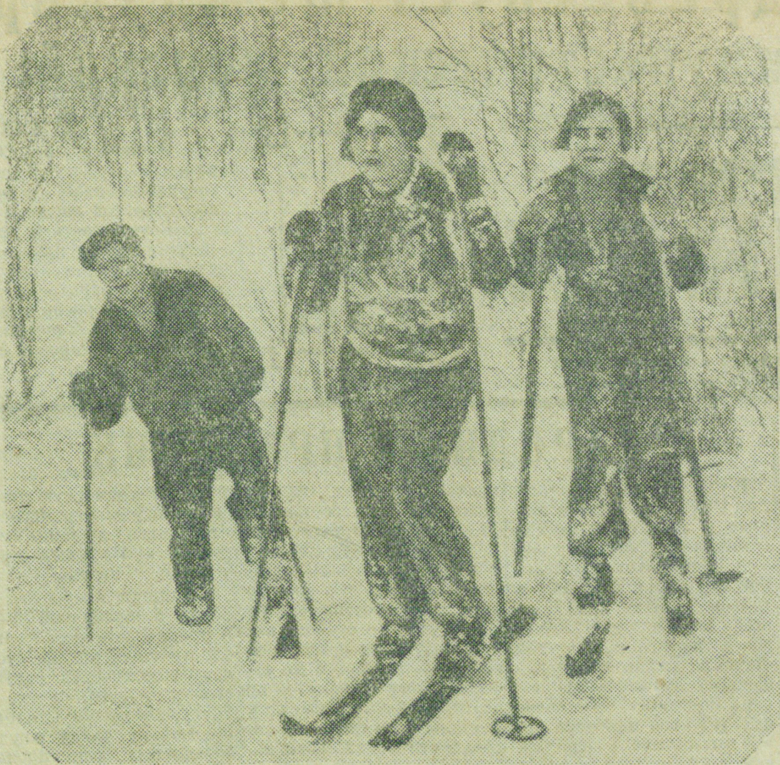
От мороза звенит воздух. Сынучий снег хрустит под ногами. Деревья — седые от инея. Разве можно в такой день усидеть дома?