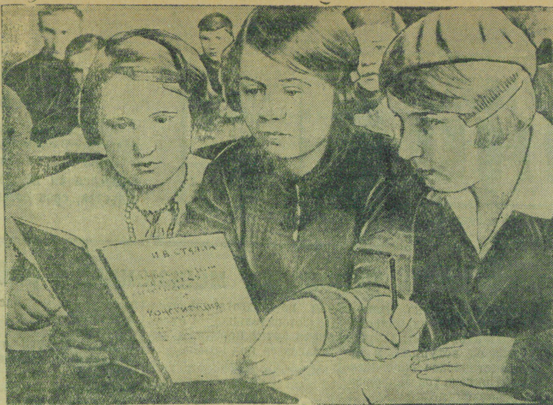
НА СНИМКЕ: на уроке Конституции в Псковском сельскохозяйственном техникуме

Создается также и соответствующая бытовая обстановка: готовится особый пасхальный стол, пекутся куличи, творожные пасхи, красятся яйца. Верующие ходят после заутрени на могилы родственников с тем, чтобы „подкормить“ их и „побеседовать“ с умершими. Все эти дикарские, языческие пережитки „святая“ христианская церковь охотно включила в свой культ, прекрасно понимая, что бытовое оформление религиозного праздника играет немаловажную роль в закреплении реакционной религиозной идеологии, тем самым и господства эксплуататорских классов.