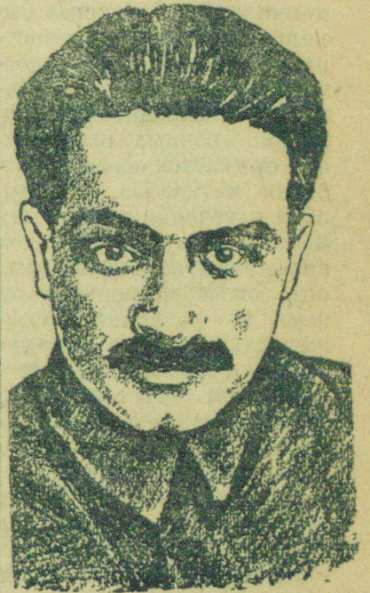
Заместитель председателя Совета Народных Комиссаров СССР тов. Анастас Иванович МИКОЯН.