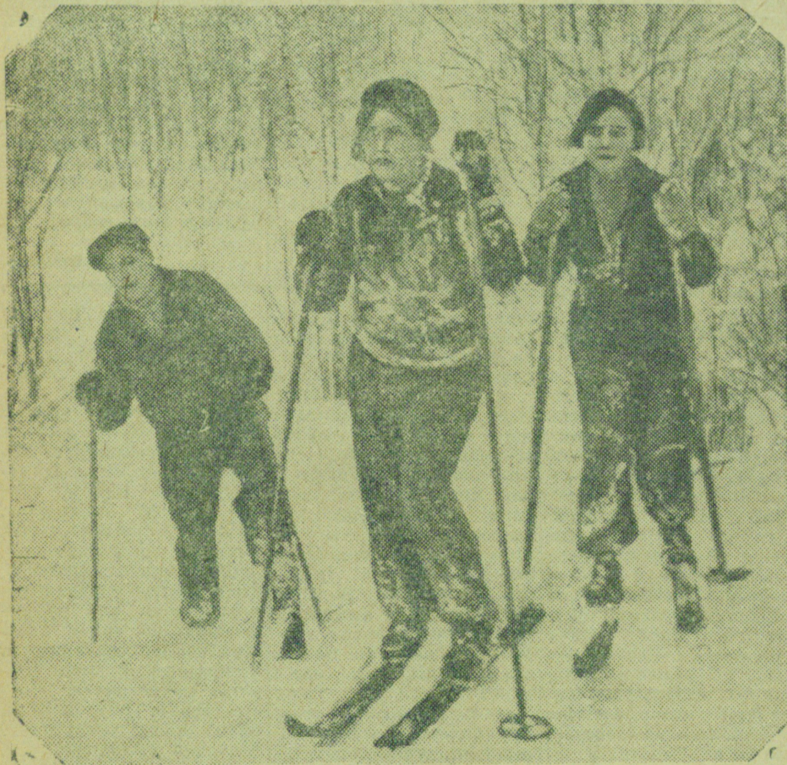
По первому снегу

Врид. ответственного редактора И. МАКАРОВ.