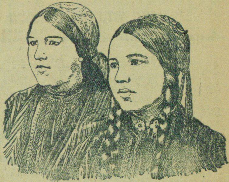
На ашхабадской текстильной фабрике имени Дзержинского растут замечательные молодые работницы-туркменки, в совершенстве овладевающие техникой производства.