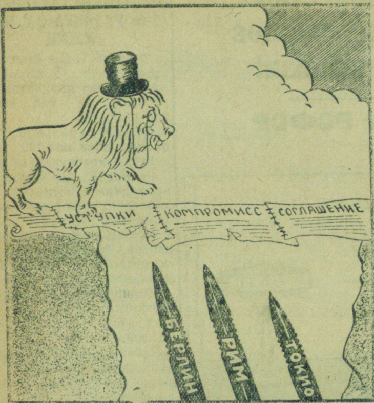
Волчья яма в дипломатических джунглях.