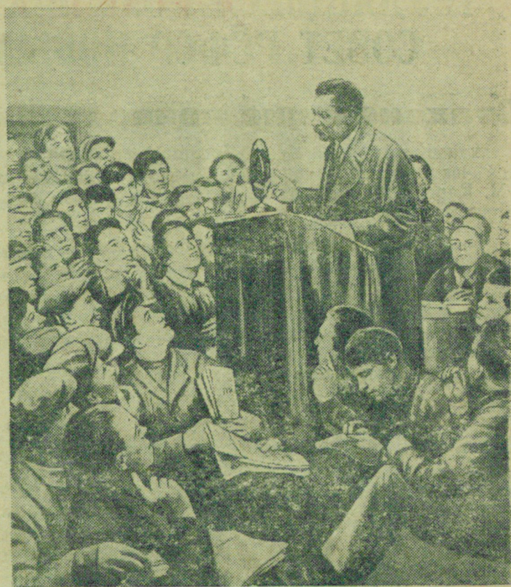
Репродукция с картины художника И. Бродского «М. Горький у рабкоров».