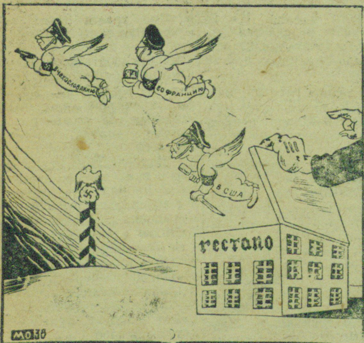
Все дороги идут... из Гестапо.