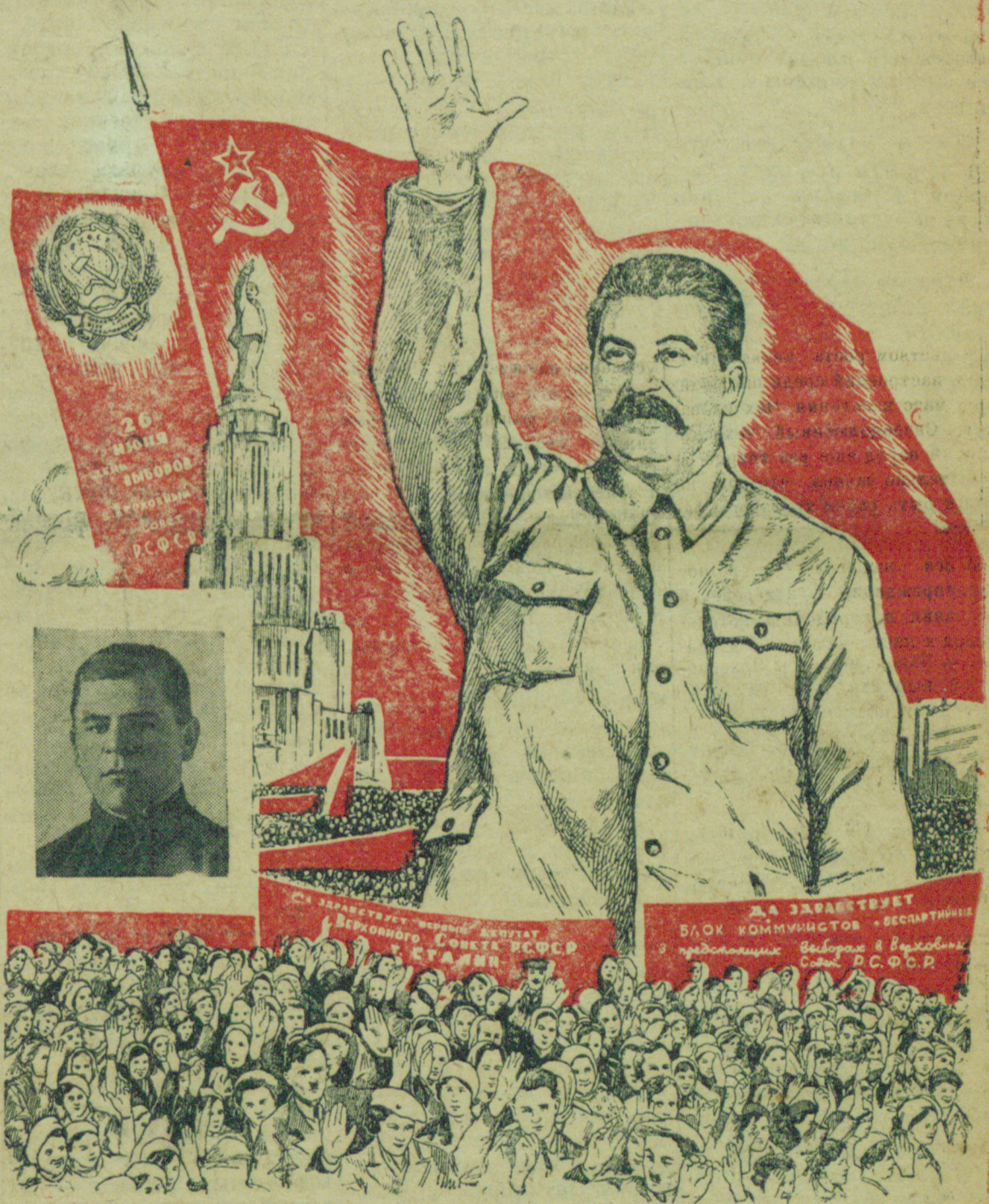
Рисунок Л. О. „Союзфото“.

Хитрые уловки, ухищрения и маскировки, к которым прибегает враг, не помогли ему уйти от ответственности. На страже социалистической родины стояли зоркие часовые и среди них бойцы отделения, возглавляемого любимым сыном народа, достойным кандидатом, питомцем коммунистической партии и ленинского комсомола, Мар-