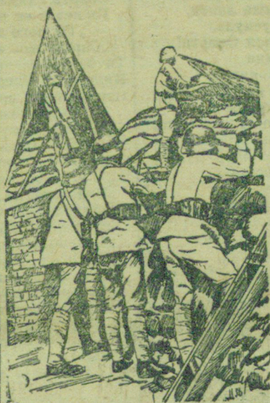
Рисунок «Союзфото» к военным действиям в Китае. На рис.: бойцы Китайской армии на позиции.

Особенно тяжелые бедствия и лишения новый кризис несет трудящимся фашистских стран — Германии, Италии, Японии. Их экономика подорвана войнами, которые ведут фашистские агрессоры, и лихорадочной подготовкой к новым военным захватам. Чтобы обеспечить сырьем военные заводы, фашистские власти лишают сырья предприятия, работающие для мирных нужд. В Германии, Италии и Японии огромные массы трудящихся лишены работы.