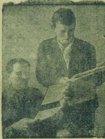
Рабочие завода „Память Парижской Коммуны“ (Верхняя Волга) являются владельцами облигаций займа на сумму свыше одного миллиона рублей.

Сейчас сумма подписки по второму руднику составляет 51101 рубль. Иванов.