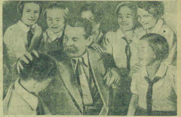
А. М. Горький и пионеры—авторы книги «База курносых» (1934 г.)