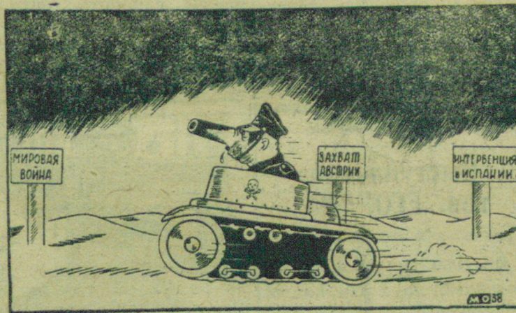
Столбовая дорога германского фашизма. Рис. М. Отарова („Прессклише“)

УТЕРЯН пропуск на право входа на территорию шахты им. С. М. Кирова № 105 им. М. А. Ершовой. Считать недействительным.