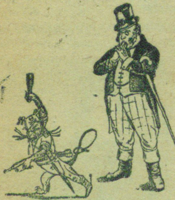
— А Васька слушает да ест...