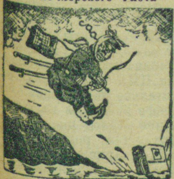
На рис.: „Крепко била Красная Армия японо-манчжурских налетчиков“. Рис. („Пресеклише“).