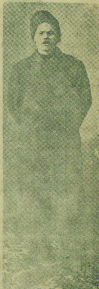
А. М. Горький в 1898 г. (Н.-Новгород).